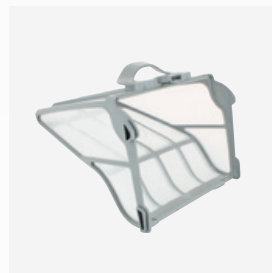
Filterkorb (400μ) für natürliche und Biopools